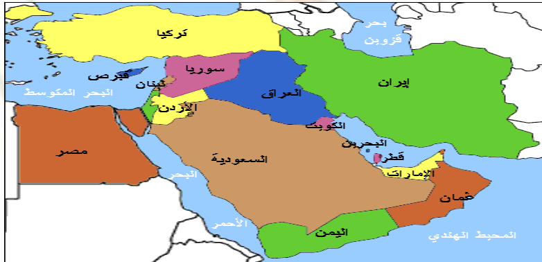
شكل رقم (٢): خارطة الشرق الأوسط